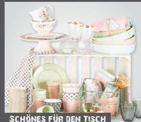
SCHÖNES FÜR DEN TISCH