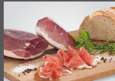
FLEISCH- UND WURSTWAREN AUS EIGENER HERSTELLUNG

IMBISS UND MITTAGSTISCH Genießen Sie unseren täglich wechselnden Mittagstisch in unserem Imbiss.