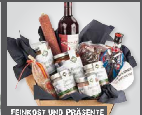
FEINKOST UND PRÄSENTE

Fleischerei Nier GmbH & Co. KG | Schötmar | Lemgo | Bad Salzuffen | Markthalle Herford | www.fleischerei-nier.de