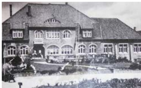
Gast- & Pensionshaus Düsenberg