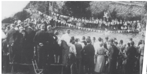
Einweihung der Badeanstalt mit Schwimmfest.

Die Badeanstalt gab es nicht mehr. Für Schulsport und aufstrebenden Fußball reichte es noch ein paar Jahre, doch das Gelände war zu anfällig für Morast usw. Ab dem